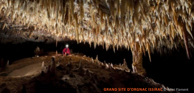
GRAND SITE D'ORGNAC ISSIRAC