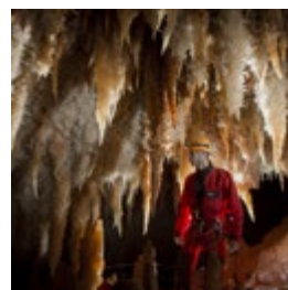
BALISAGE DISCRET © Rémi Flament