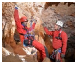
SPÉLÉOLOGIE ET HANDICAP