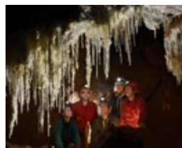
DÉCOUVERTE ET PARTAGE

Imprimé en France sur papier FSC / © Réalisation : bacabab-conseil.fr