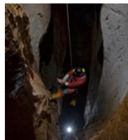
DESCENTE DANS UN PUIT