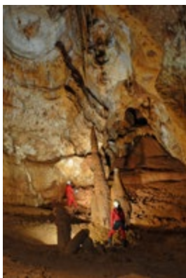
GRAND SITE D'ORGNAC ISSIRAC

La FFS, avec son agenda 21, s'inscrit dans la démarche de développement durable initiée par les instances du CNOSF (Comité national olympique et sportif français) et le mouvement sportif français.