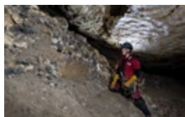
REMPLISSAGE : PALÉOENVIRONNEMENT