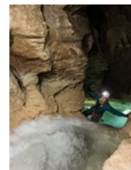
RIVIÈRE SOUTERRAINE