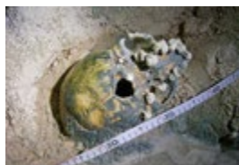
CRÂNE CALCIFIÉ : ARCHÉOLOGIE