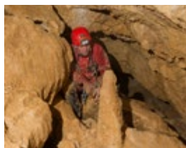
STALAGMITE : DATATION PALÉO-TEMPÉRATURE

Les engagements de la FFS en matière de conservation des milieux naturels sont développés sur la base de la connaissance et de la gestion partagée des milieux de pratique.